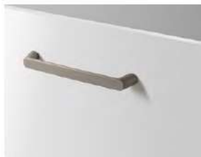
T-147 (758 points)