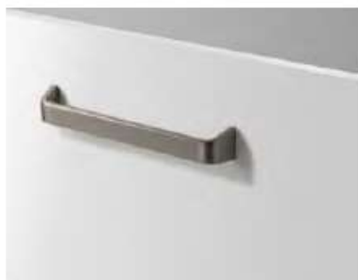
T-148 (778 points)