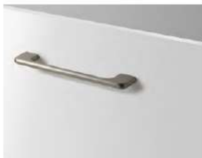
T-146 (682 points)