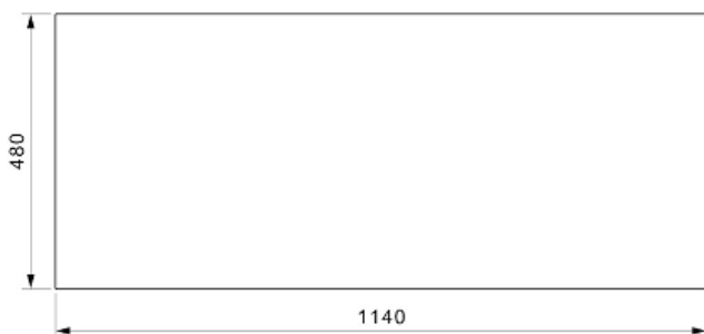
Rex 30 Uitsparing Blad Aussparung Platte Cut out worktop